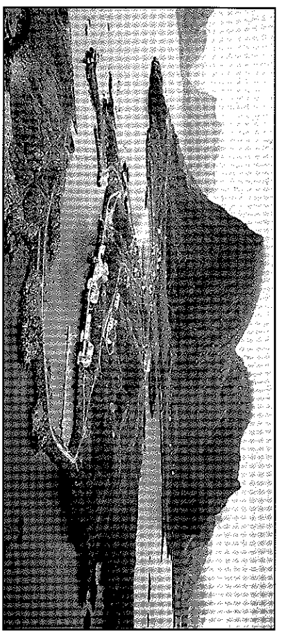
Flyfoto Hovden.